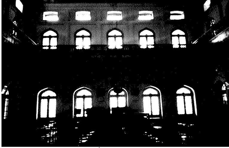
حبیبیہ حال، اسلامیہ کالج، لاہور