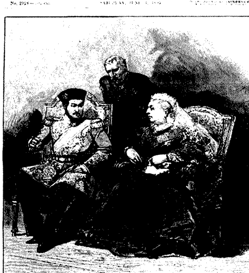
دورہ انگلینڈ ۱۹۸۵ء کے موقع پر شہزادہ نصر اللہ ملکہ وکٹوریہ سے ملاقات کر رہا ہے۔